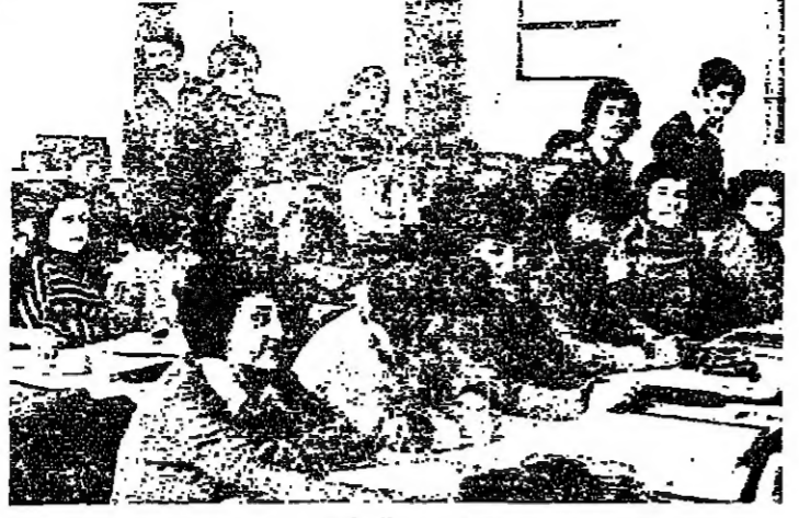
داخل احد الصفوف